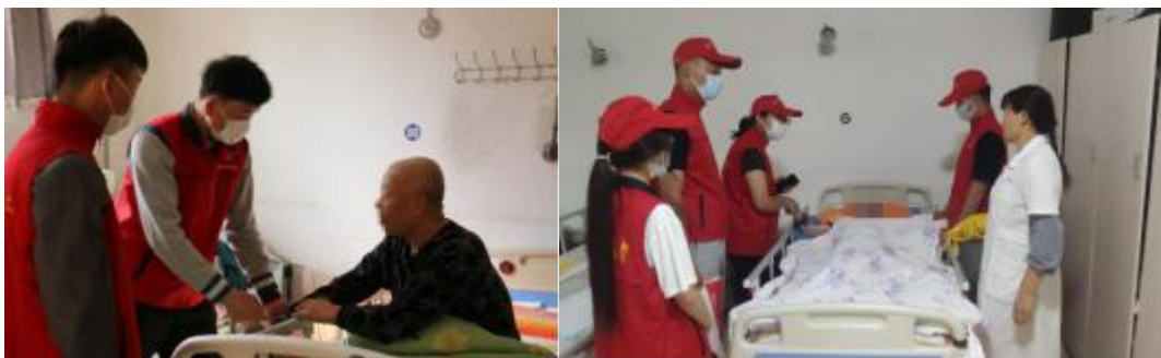
爱老助老志愿服务活动

2020年下半年开展“月行一善、一元做公益”爱老助老志愿服务活动，帮助一位卧床8年多，生活不能自理的老人，连续5个月，共捐款4751.53元，每月由志愿者代表到芝罘区宏发养老院看望老人，并缴纳护理费。项目运行5年来，学生换了一届又一届，但是服务宗旨始终未变，一直秉持踏踏实实用真情服务孤寡老人，用爱温暖整个四季。