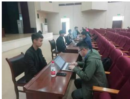
图 1: 学生参加企业面试

加强组织领导,强化责任担当,精准协调推进。认真贯彻党中央、国务院决策部署,全面强化“保就业”“稳就业”“就业优先”政策,层层压实责任,以世界 500 强、大型央(国)企、上市公司、成长性好的公司,国内发达地区的工业园区、山东省、烟台市龙头行业、重点企业作为主要服务对象,采取线上线下相结合的方式,主动与用人单位对接,先后与烟台开发区、烟台高新区、青岛市汽车工业园、烟台市上汽通用(东岳)汽车工业园、潍坊市新能源汽车开发区等 20 多个国家级、省级知名开发园区建立战略合作关系。