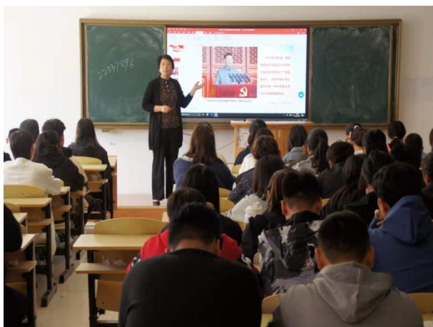
图 2：学校校长讲授思政课