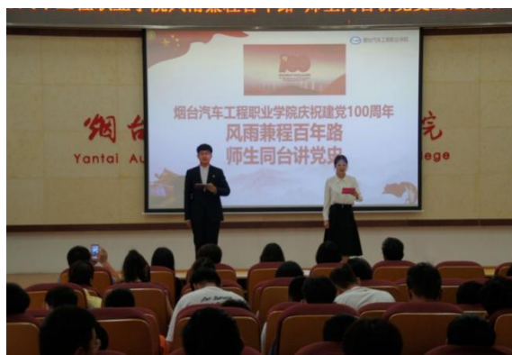
图 1：“风雨兼程百年路，师生同台讲党史”